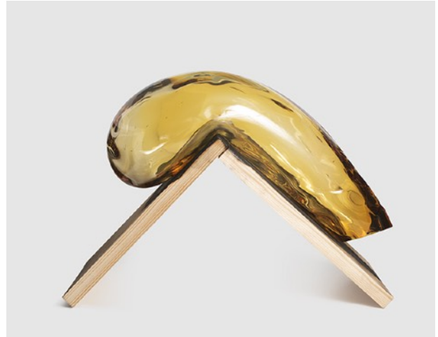
HONEY HONEY #4, 2018 Verre soufflé, pigment, bois 25 x 25 x 25 cm 8 000 euros