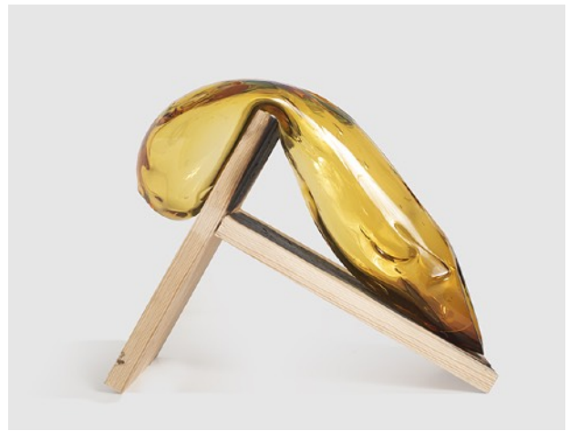
HONEY HONEY #2, 2018 Verre soufflé, pigment, bois 25 x 25 x 25 cm 8 000 euros