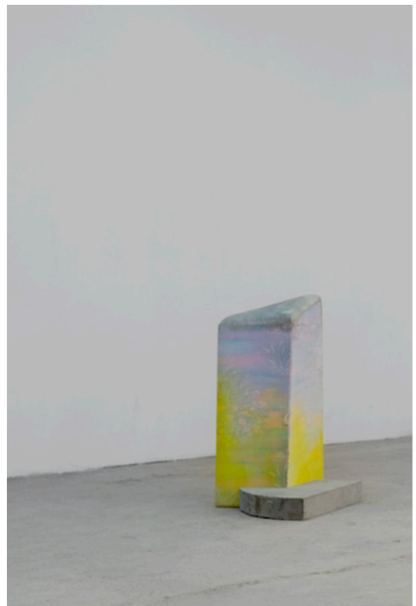
ANDROGYNE, 2016 Tissu, béton 100 x 70 x 75 cm 7 000 euros Courtesy Wild Projects