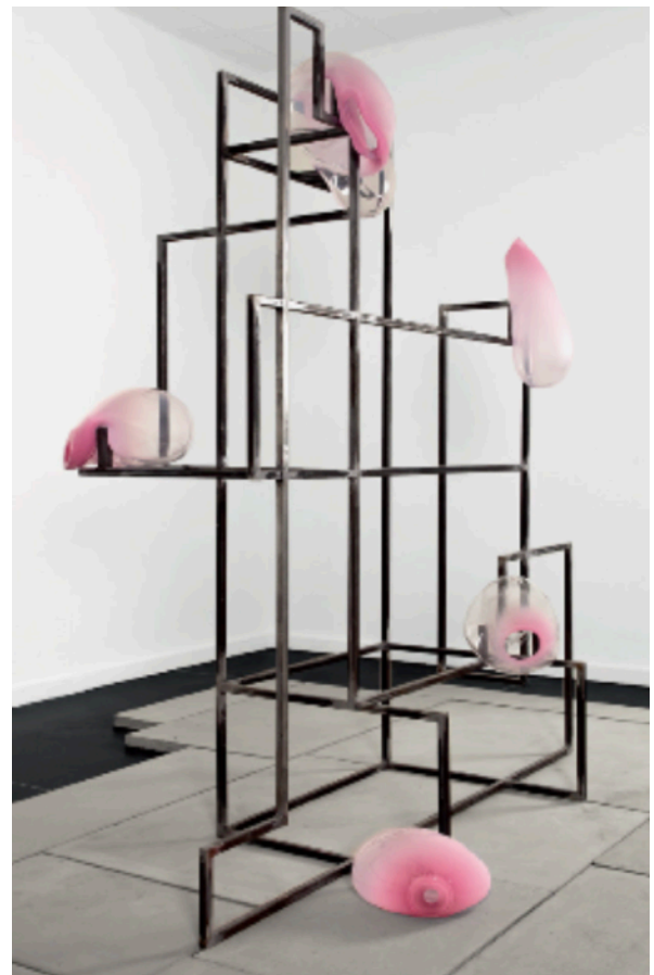
BUBBLES # ROSE, 2015 200 x 100 x 75cm 40 000 euros