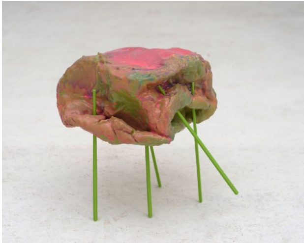
SILLY WALK #1, 2016 Céramique, résine, baguettes chinoises 25 x 25 x 25 cm 2 000 euros