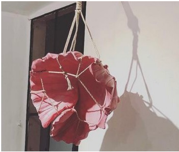
SHIBARI #1, 2020 100 x 70 x 70 cm 30 kg 12 000 euros