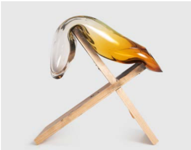
HONEY HONEY #3, 2018 Verre soufflé, pigment, bois 25 x 25 x 25 cm 8 000 euros