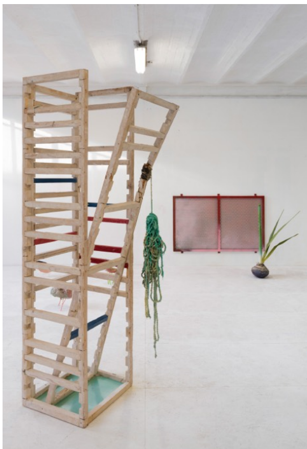
LA PÉPIE, 2016 Bois, corde, résine 250 x 67 x 67 cm 12 000 euros