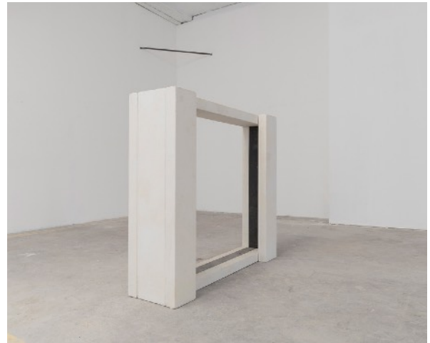
SANS TITRE, 2016 Bois, papier japonais 150 x 120 X 50 cm 9 000 euros