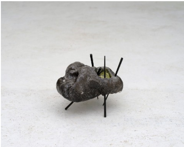
SILLY WALK #3, 2016 Céramique, résine, baguettes chinoises 25 x 25 x 25 cm 2 000 euros