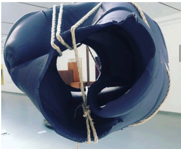
SHIBARI #3, 2019 100 x 70 x 70 cm 30 kg 12 000 euros