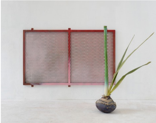
CAGE DE FARADAY, 2016 Technique mixte 178 x 107 X 4 cm 9 000 euros