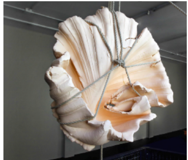
SHIBARI #2, 2019 100 x 70 x 70 cm 30 kg 12 000 euros