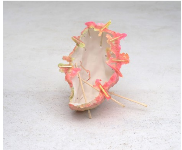
SILLY WALK #2, 2016 Céramique, résine, baguettes chinoises 25 x 25 x 25 cm 2 000 euros