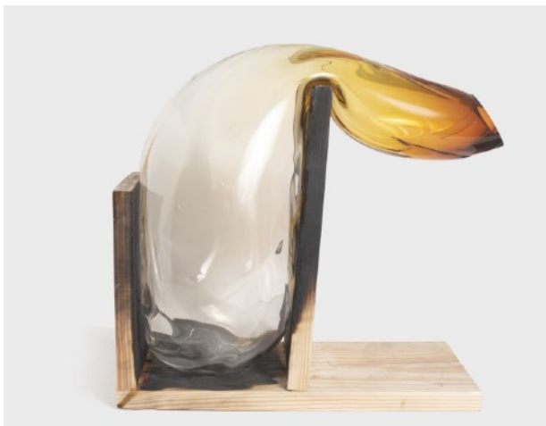
HONEY HONEY #5, 2018 Verre soufflé, pigment, bois 45 x 25 x 25 cm 8 000 euros